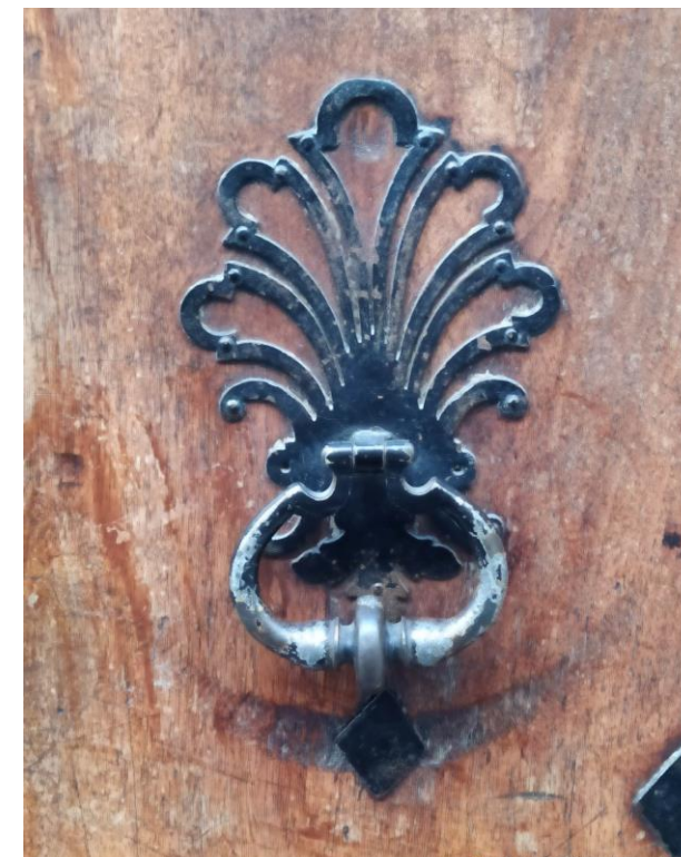
Heurtoir de porte, rue Mathieu de la Drôme Romans-sur-Isère